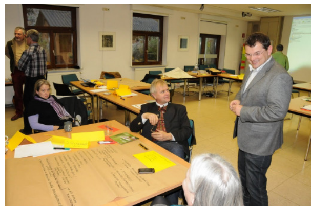
Abbildung 7: Pausengespräche