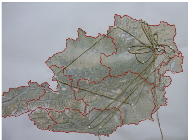
Abbildung 5: Vernetzung der Workshop-Teilnehmer

Teilnehmer aus unterschiedlichen Tätigkeitsbereichen (Behörde, NGO's, Naturschutz, Forst, Jagd, Wissenschaft) brachten ihr Wissen ein. Am Beginn stand die Vorstellungsrunde, in der die Vernetzung der Teilnehmer sichtbar gemacht wurde (siehe Abbildung 5)