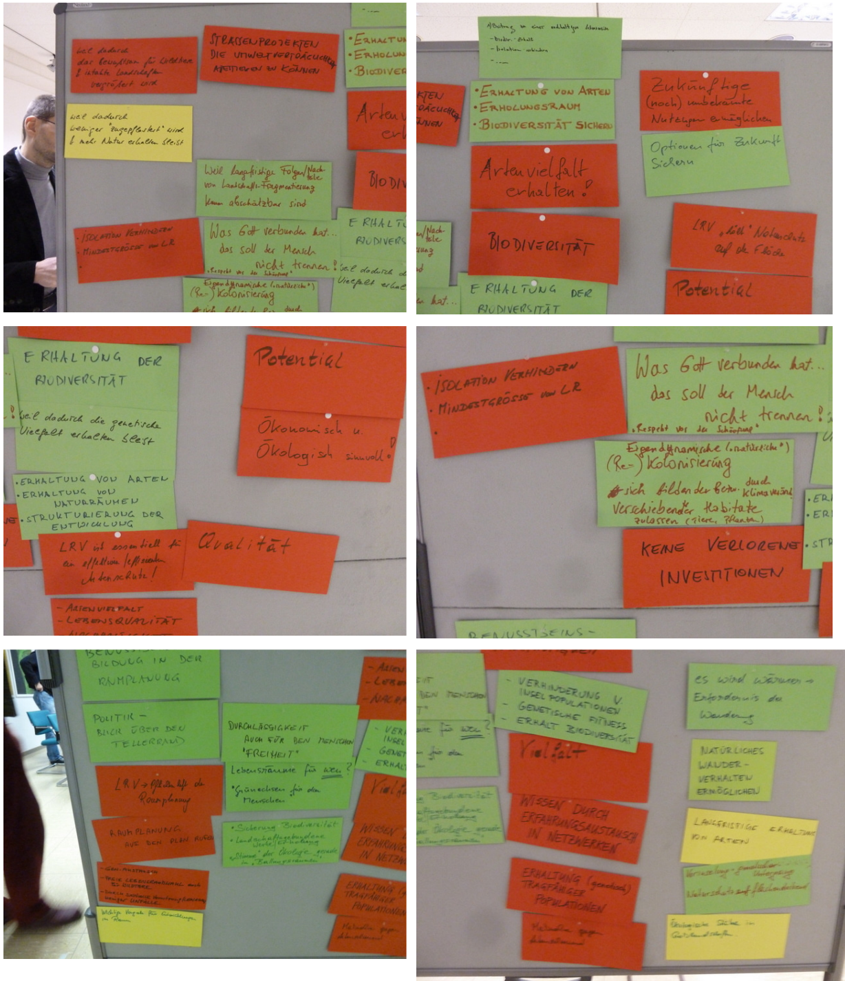
Abbildung 6: Überblick: Lebensraumvernetzung ist mir wichtig weil...